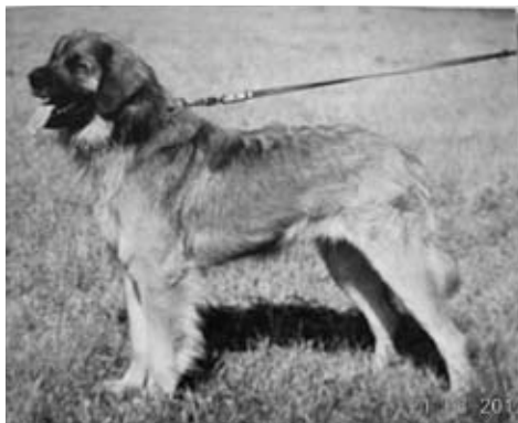
Leonberger v Atlasu plemen psů, 1981