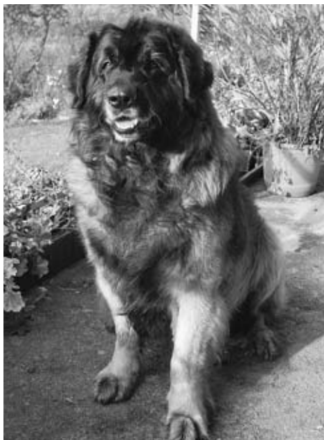
Barvik Sen Rodiny – 8,5 roku

I když moje srdce touží opět po tak skvělém parťákově, který se sám od sebe ani v lese překypu-