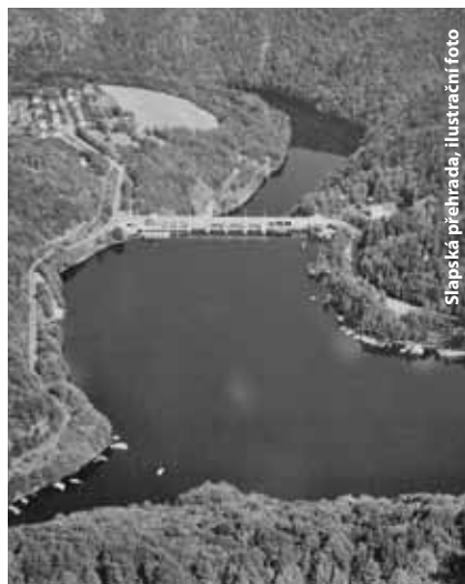
Slapská přehrada, ilustrační foto

Dovolená se psy (víkendy, setkání přátel) v samostatných chatičkách s krytou verandou v oploceném areálu přímo u lesa. Slapské jezero cca 200 m. Velká soukromá louka cca 30 m.